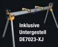
Inklusive Untergestell DE7023-XJ